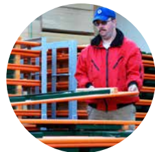
1. ein stapeln